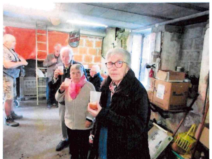
Après avoir planté des pommiers, l'établissement a déjà pu produire 90 litres de jus de pommes.