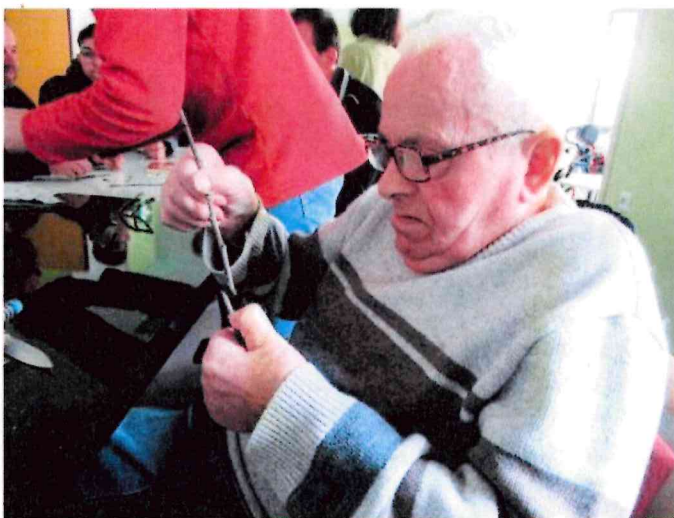
L'association a mené des activités autour du greffage d'arbres.